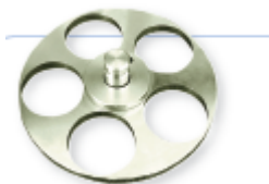
Portamuestras Presión Individual