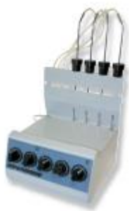
Dosificador Topas 130