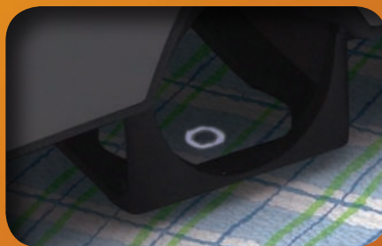
Visualización Line of Sight™ con Active Visual Targeting™

VS450 es la solución a muchos de los problemas de medición que hasta ahora no se podían resolver. Productos que normalmente requieren no entrar en contacto físico con la muestra, como líquidos y pastas, o cuya apariencia se ve modificada por el método de presentación, como cuando la muestra se presiona detrás de un cristal, ahora pueden medirse en su estado natural, sin alterarlo, tal y como el ojo los ve.