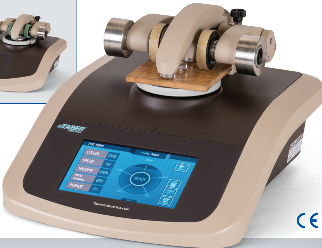
MODELO 1700 Abrasímetro de plataforma única