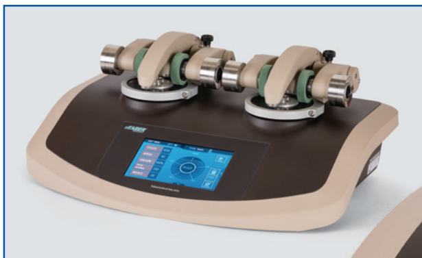
MODELO 1750 Abrasímetro de doble plataforma