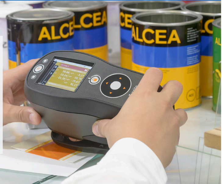
▲ IMAGEN: Ci60 tomando mediciones de muestras en el laboratorio